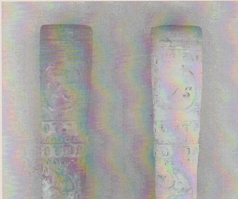
Afbeelding 4: Pijpen uit de voormalige collectie Ziegler (links) en Keizersgracht (rechts)