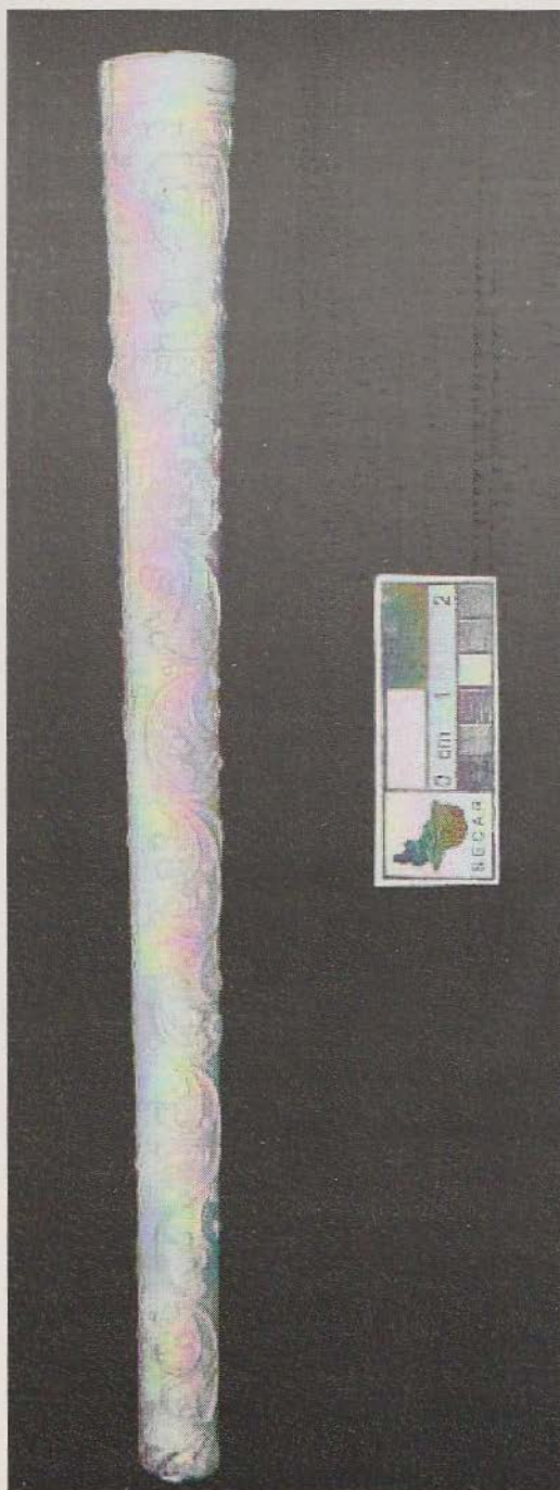
Afbeelding 2: Pijp uit collectie SECAR

Het stoppen van deze pijp als "tabakspijp" zal een ware klus geweest zijn. In tegenstelling tot de grote ketelopening van de meer gangbare modellen zoals het ovoïde -, en het zijmerkmodel, is de opening van deze pijp niet meer dan 1 cm. Dit, in combinatie met de dunne ketelwand maakte dat de kans dat er een scherp uitbrak groot was. Tevens zit de tabak door de nauwe, conische vorm van de pijp al snel vast. Bovendien, de pijp met een pijpenwroeter weer schoonmaken zal ook niet eenvoudig geweest zijn; je blijft de tabak met de wroeter aandrukken omdat je niet achter de tabak kan komen.