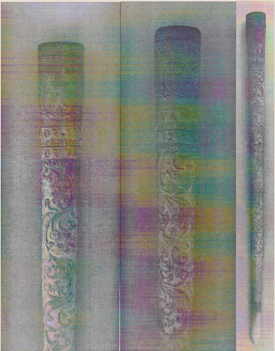
Afbeelding 1: Pijp uit de voormalige collectie van Alexander Ziegler